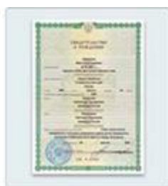
Свидетельство о рождении ребенка