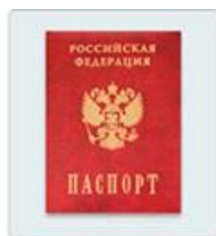
Главная страница паспорта или другое удостоверение личности родителя

Шаг 2. Заполните заявление: зайдите на сайт госуслуг под своим логином и паролем, выберите «Запись в детский сад». Заполните заявление и прикрепите к нему фотографии документов: